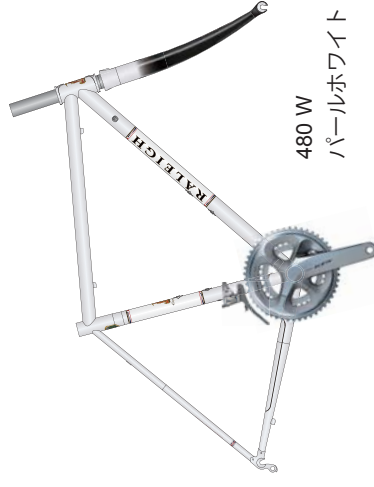
480 W パールホワイト