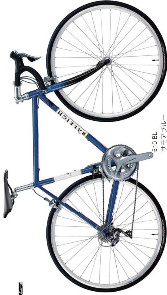
510 BL サモアブルー